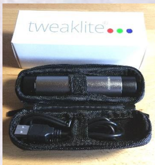
Auch im mobilen Einsatz gut geschützt im schwarzen Täschchen