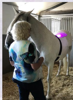
Beispielanwendung bei Pferden