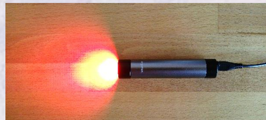
Farblicht-Power „ohne Ende“